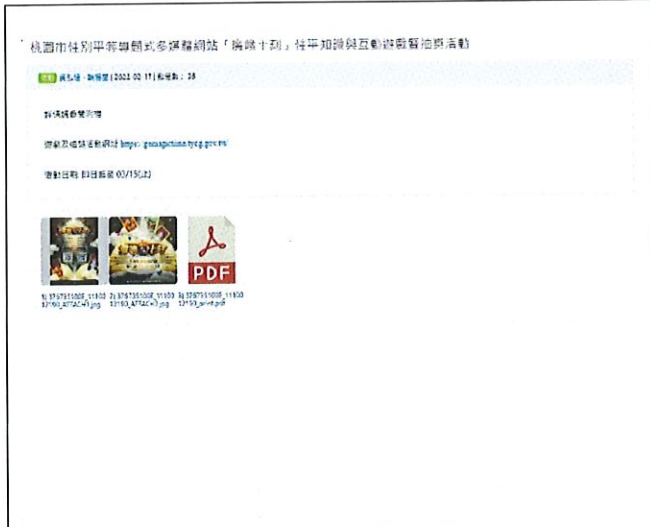
文字說明：111.02.17 指導全校學生參與市府性平專題式多媒體站 體驗活動